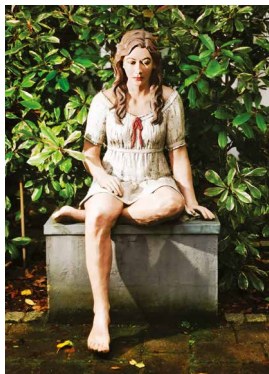
Foto: Skulptur von Gabriele Köbler „Marleen“ - sitzende Figur lebensgroß 2023 / Feinbeton / Auflage 5 Mehr Infos unter www.gabriele-koebler.de

Weitere Informationen finden Sie unter www.schulhaus-schweigen.com