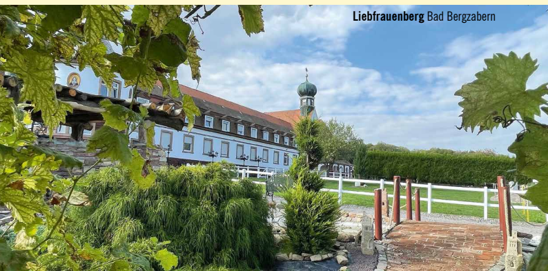
Liebfrauenberg Bad Bergzabern

18:00 Uhr ROSENWOCHEN - Krimilesung mit Gina Greifenstein - Details siehe Seite 42